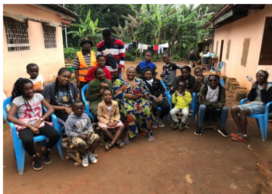
Visite de la colonie du Solutré batack au QG de l'AEBA