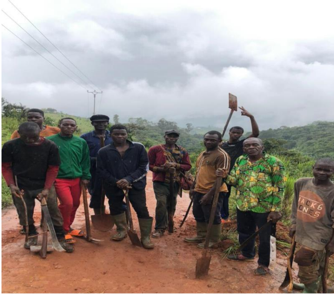
Réhabilitation de l'axe place de la jeunesse-tunnel