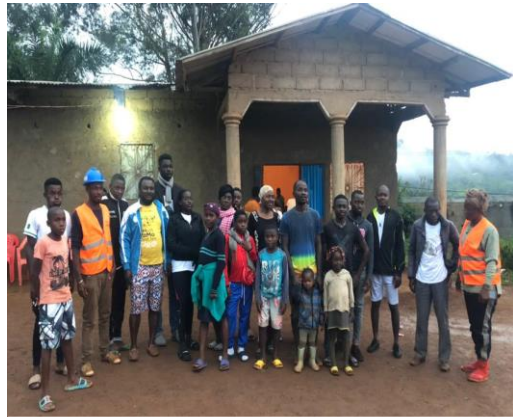
Visite de l'AEBA a la jeunesse batoula