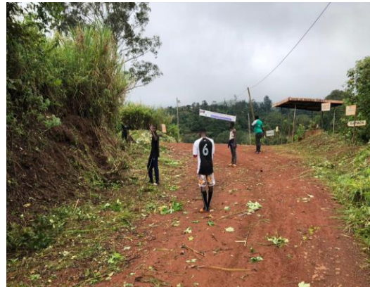
Nettoyage de la gare de batack Ouest