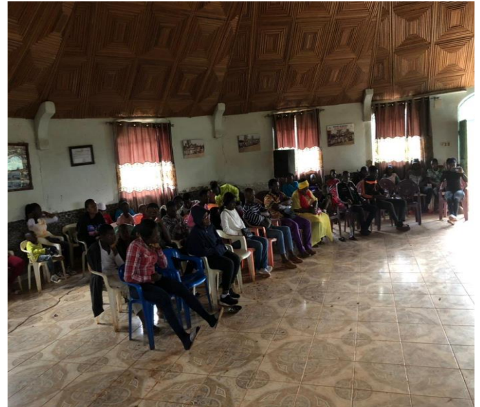
Journée de l'orientation scolaire et professionnelle