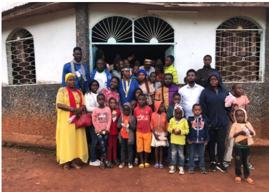
Conférence sur le thème : relation parents-enfants